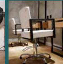
Visagie- en kleedruimte