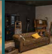
Dark academia stijl woonkamer