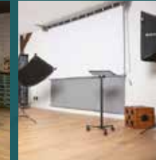
Neutrale (witte) portretstudio